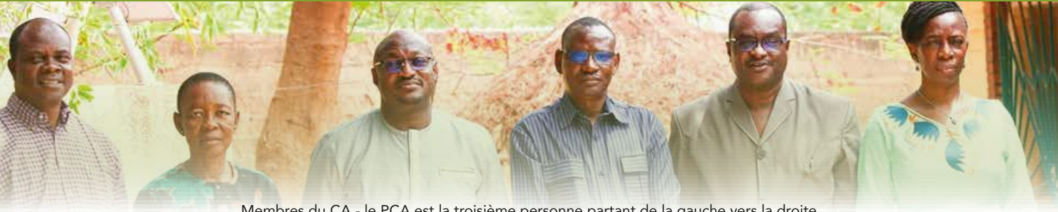
Membres du CA - le PCA est la troisième personne partant de la gauche vers la droite

La mission principale du RAME est d'influencer les politiques publiques pour un accès équitable des populations aux soins de santé de qualité.